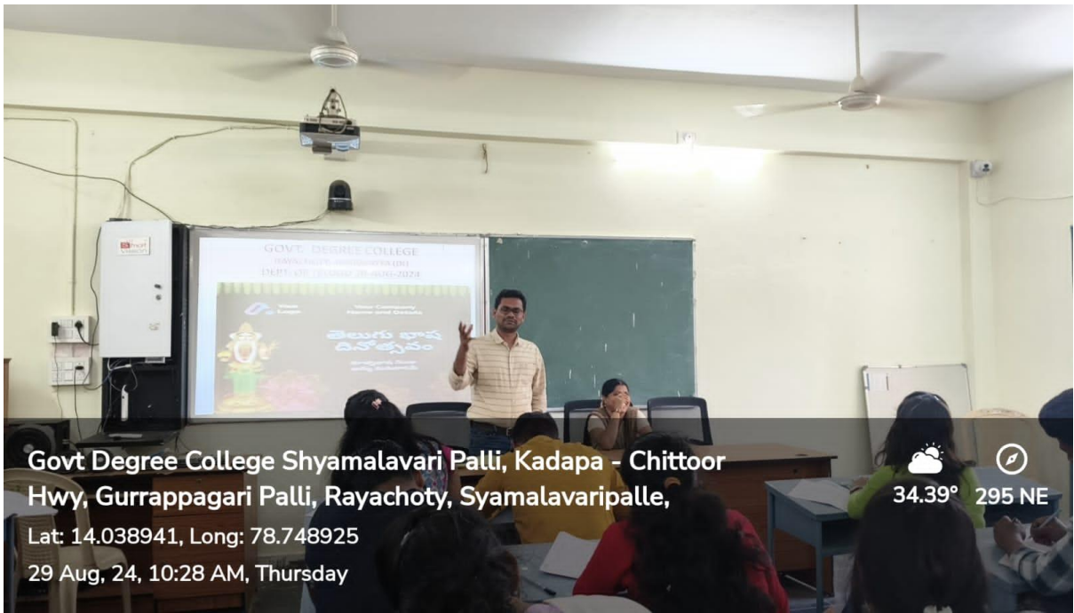
Govt Degree College Shyamalavari Palli, Kadapa - Chittoor Hwy, Gurrappagari Palli, Rayachoty, Syamalavaripalle, Lat: 14.038941, Long: 78.748925 29 Aug, 24, 10:28 AM, Thursday